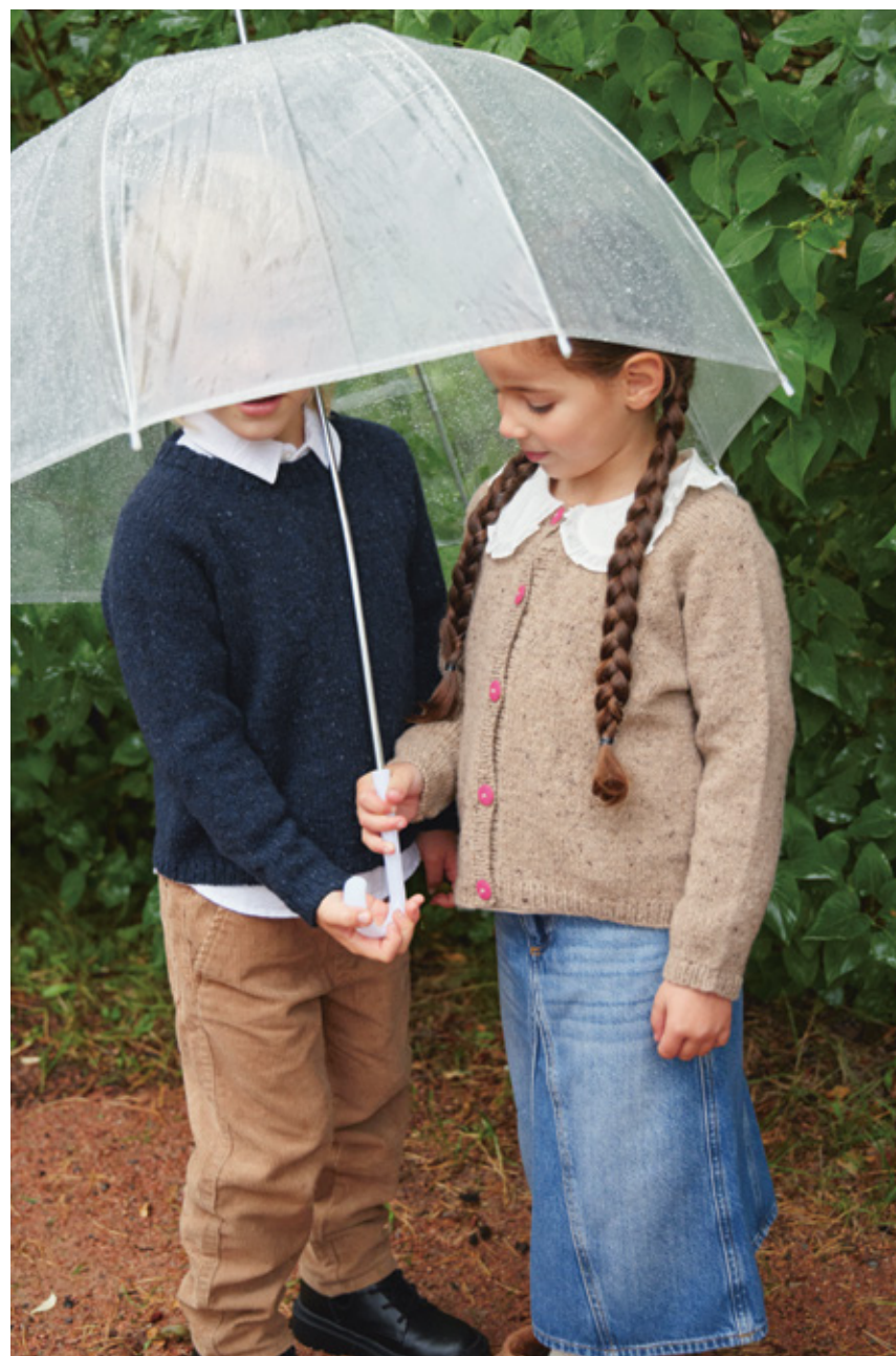
2312 2A OG 2B | TWEED RECYCLED | \times 3½ | \frac{\wedge\wedge\wedge}{21 | 10} | • DEBUTANT CRDIGAN TWEED EDITION 2-12 ÅR (ovenfra og ned) eller (nedenfra og opp)