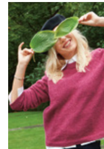
DEBUTANT SWEATER TWEED EDITION Tweed Recycled Design 1