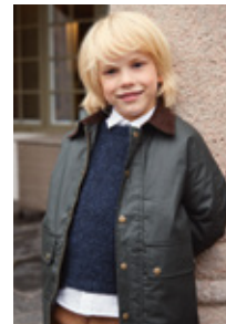
DEBUTANT SWEATER TWEED EDITION Tweed Recycled Design 3