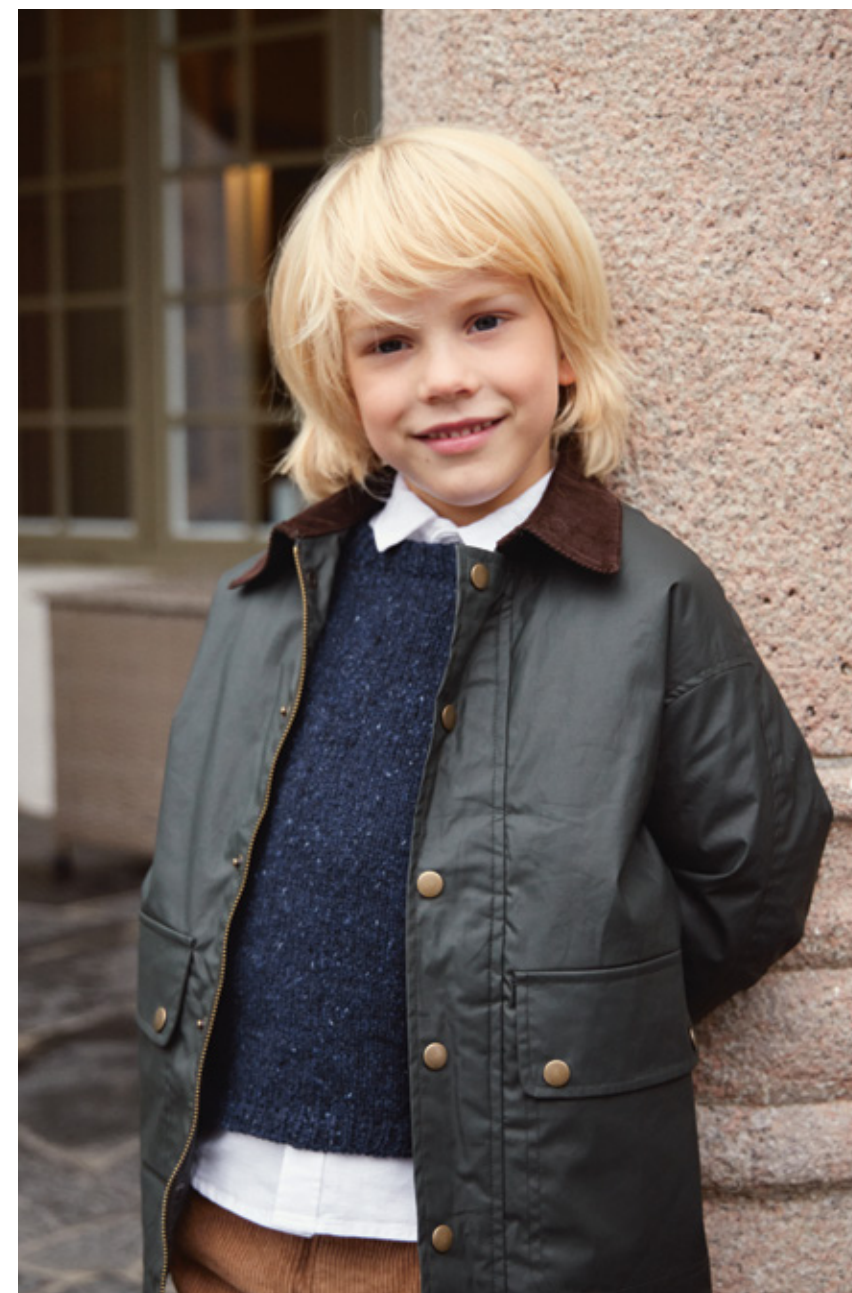
2312 3A OG 3B | TWEED RECYCLED | \times 3½ | \frac{\wedge\wedge\wedge}{21 | 10} | • DEBUTANT SWEATER TWEED EDITION 2-12 ÅR (ovenfra og ned) eller (nedenfra og opp)