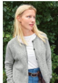
DEBUTANT CARDIGAN TWEED EDITION Tweed Recycled Design 4

EVENTUELLE RETTELSE TIL DETTE HEFTET FINNER DU PÅ SANDNESGARN.NO