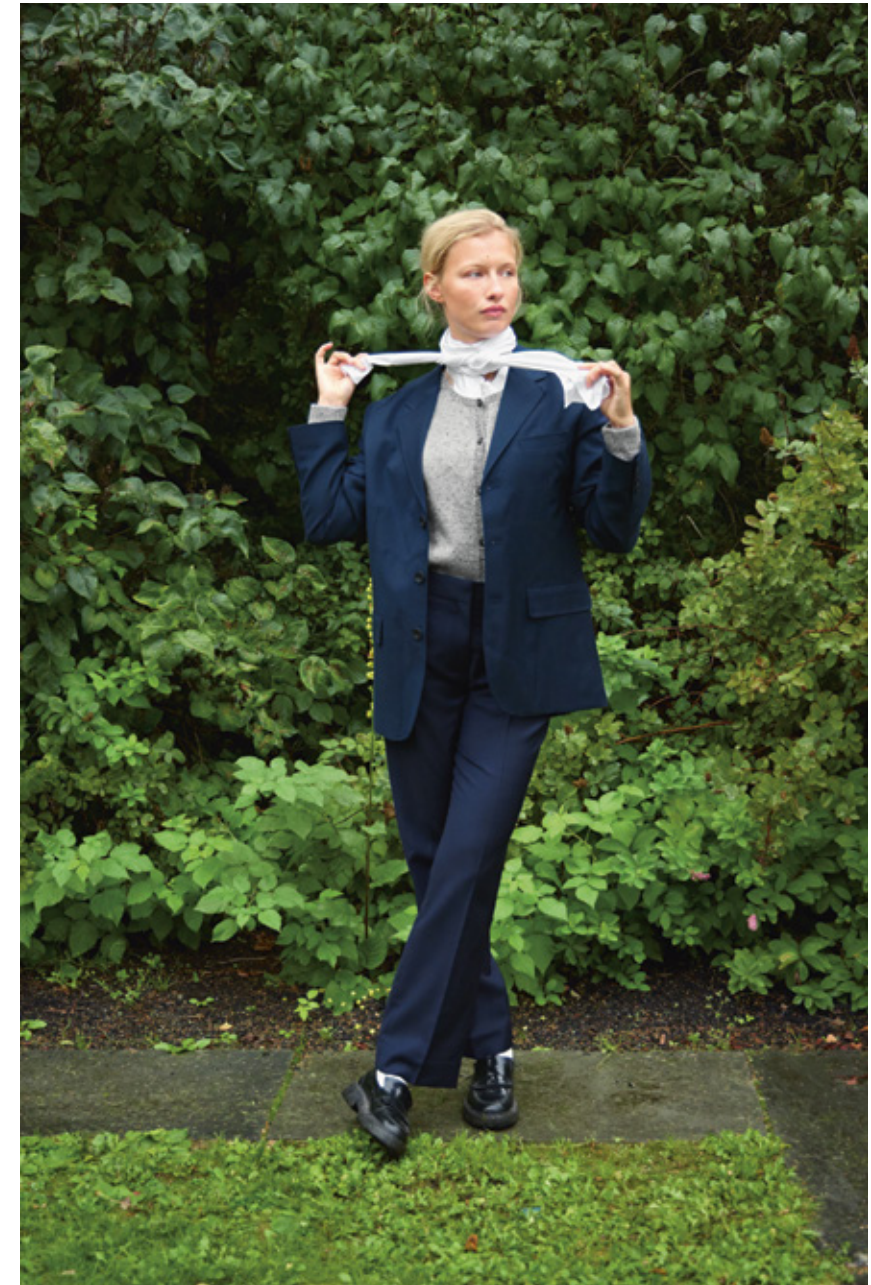
2312 | TWEED | \times 3\frac{1}{2} | \frac{\pi\pi\pi}{21|10} | • DEBUTANT CARDIGAN TWEED 4A OG | RECYCLED | EDITION 4B | XS-5XL (ovenfra og ned) eller (nedenfra og opp)