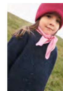
DEBUTANT SWEATER TWEED EDITION Tweed Recycled Design 10