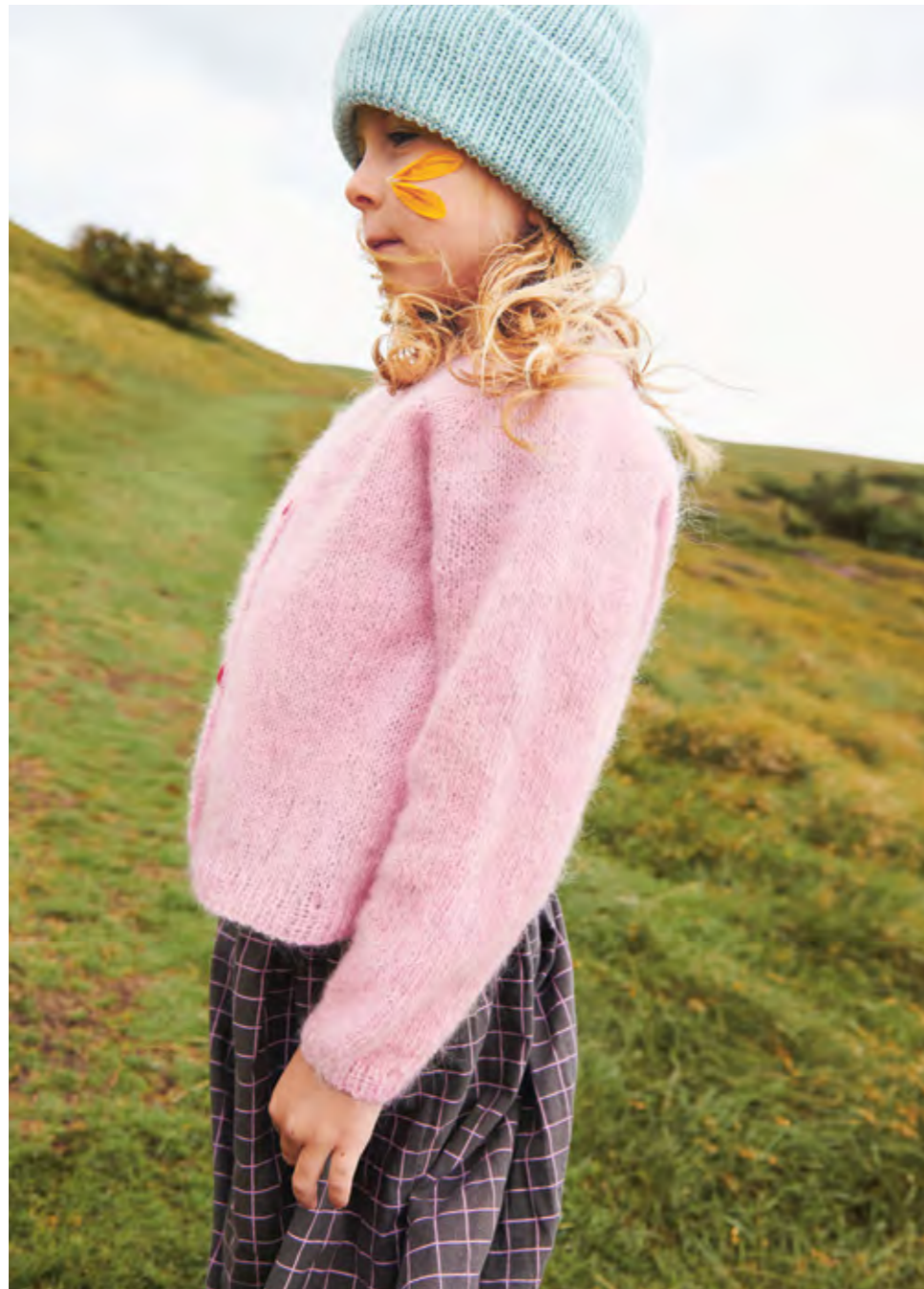
2309 | TYNN SILK MOHAIR | X 3 1/2 | 22 | 10 | • DEBUTANT CARDIGAN 2A OGB | X2 | 2 - 12 ÅR (ovenfra og ned eller nedenfra og opp)