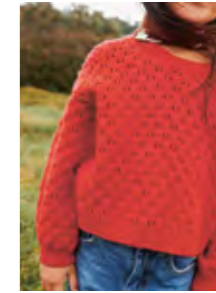
MOA GENSER Double Sunday Design 4