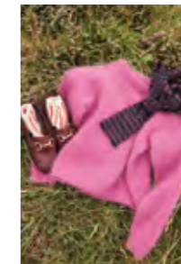
DEBUTANT SWEATER Tynn Silk Mohair x2 Design 7