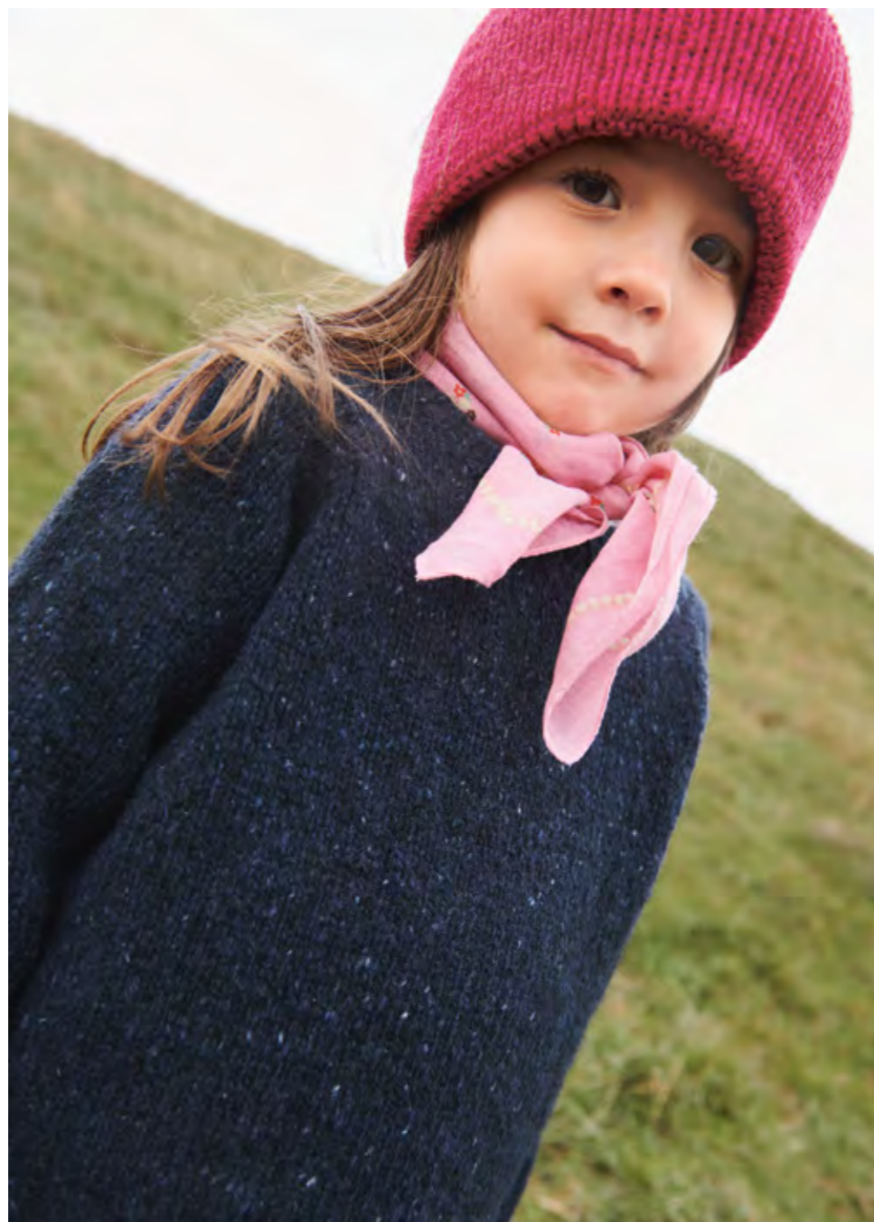
2309 | TWEED RECYCLED | \times 3½ | \frac{\text{AAA}}{21 | 10} | • DEBUTANT SWEATER TWEED EDITION 10A OGB | 2 - 12 ÅR (ovenfra og ned eller nedenfra og opp)