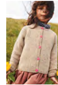
DEBUTANT CARDIGAN TWEED EDITION Tweed Recycled Design 1