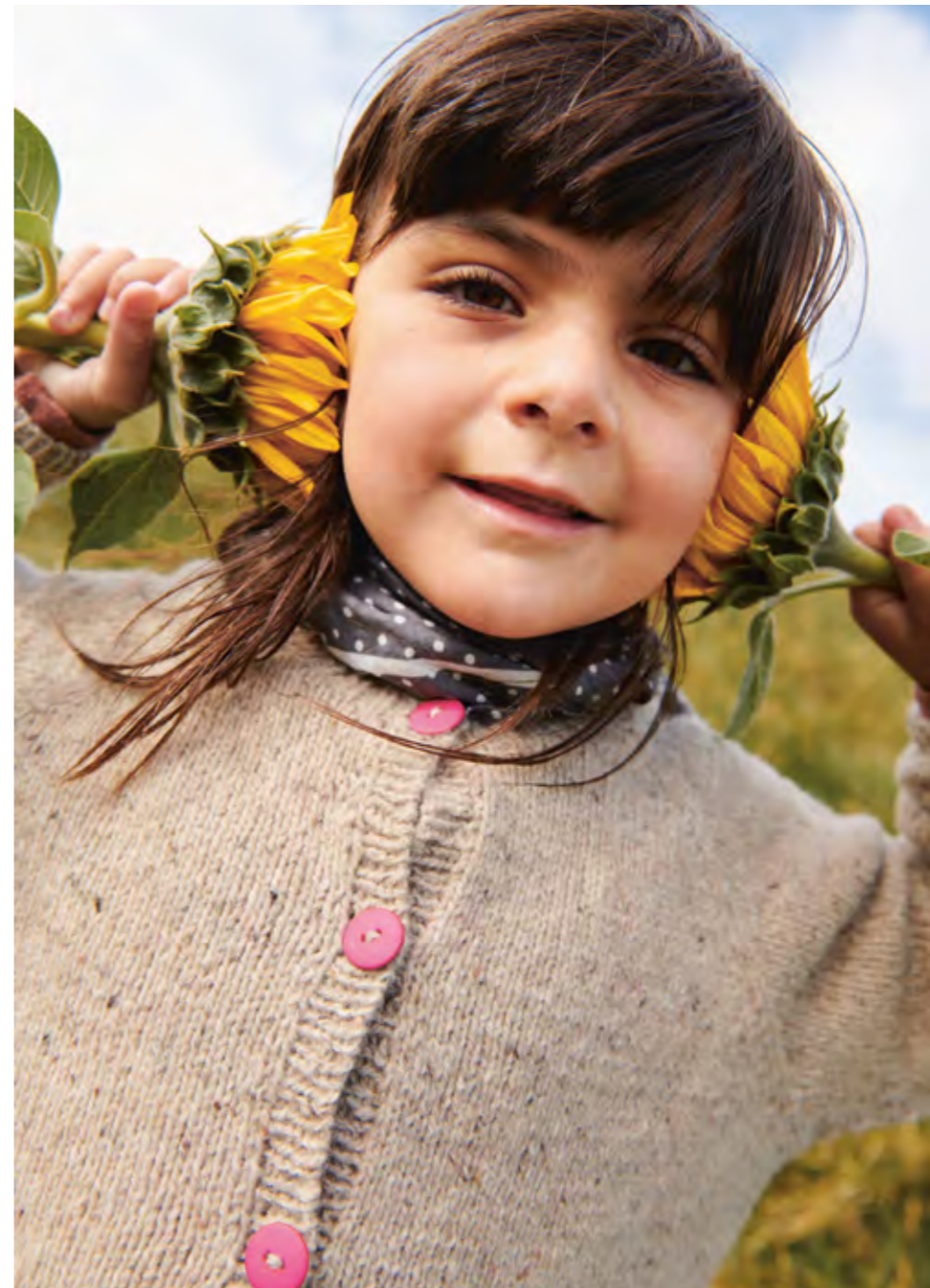
2309 | TWEED RECYCLED | \times 3½ | \frac{\text{---}}{21} | DEBUTANT CARDIGAN TWEED EDITION 1A OGB | 21 | 10 | 2 - 12 ÅR (ovenfra og ned eller nedenfra og opp)