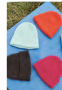
MUST-HAVE BEANIE Double Sunday Design 5