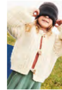
CHUNKY JAKKE Fritidsgarn + Kos Design 3