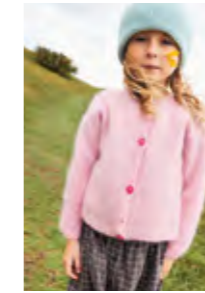
DEBUTANT CARDIGAN Tynn Silk Mohair x2 Design 2