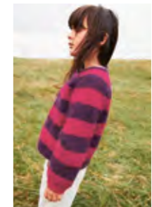
DEBUTANT CARDIGAN STRIPE EDITION Tynn Silk Mohair x2 Design 8